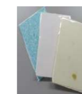
かみす紙漉きハガキ (5枚入り) ¥100