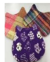
ネコのコースター ¥1,000