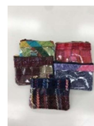
ネームホルダー (ひもなし) ¥600