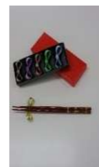
はし豆 5客セット 1箱 ¥500

みらいでは、利用者さん達と一緒に織布で小物を作成したり漉いた和紙を商品にしたりしています。写真は一部の商品となっており、続々と新作もできています。日々、利用者さんと一緒に既存商品の作成と新商品の開発を頑張っていますので、楽しみにお待ちください。