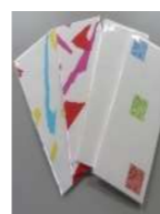
かみす紙漉きハガキ (3枚入り) ¥200