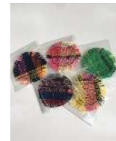
まるがたコースター ¥100