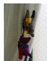
はさめるシリーズ ¥400